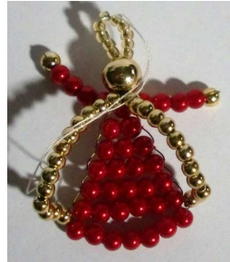
Engel von hinten